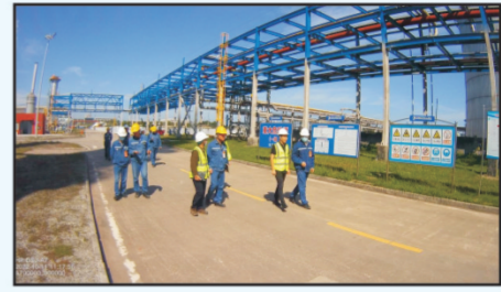
2022年10月11日，省安全生产巡查第十三组赴广安宏源化工有限公司开展巡查工作...