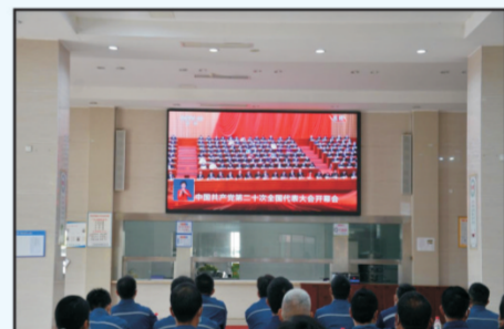
2022年10月16日上午10时，中国共产党第二十次全国代表大会在北京人民大会堂隆重开幕...