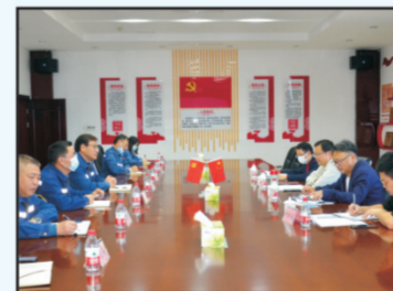
2022年11月2日，广安市生态环境保护组赴玖源化工开展抓党建促稽查工作，稽查组现场检查了我司污染防治措施落实情况...