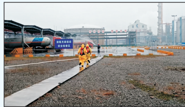
2022年10月27日，广安宏源化工有限公司生产部充装站组织举行液氨槽车泄漏中毒事故应急演练。