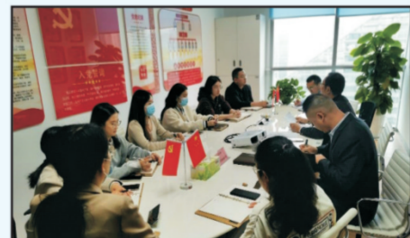
2022年10月26日下午15:00，为贯彻落实党的二十大精神，密切联系群众，走进群众，发展群众...