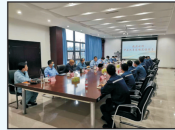
2022年10月10日至11日，广安宏源化工有限公司聘请中石化管理体系认证(青岛)有限公司...