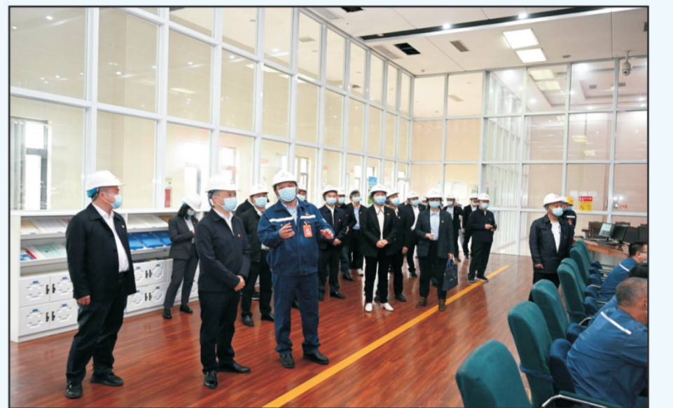
2022年10月12日下午，广安市两新组织“两个覆盖”动态清零暨新业态新就业群体党建工作现场推进会在广安经开区召开...