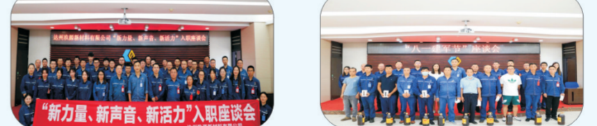
7月28日下午，达州玖源新材料有限公司召开了“新力量、新声音、新活力”入职座谈会