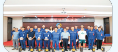
2022年8月1日，达州玖源公司党委、行政、工会联合举办了“八一”建军节退役军人座谈会