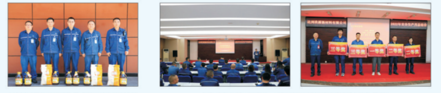
达州玖源新材料有限公司安环固废部对安全“啄木鸟”活动中表现突出的员工进行了表彰